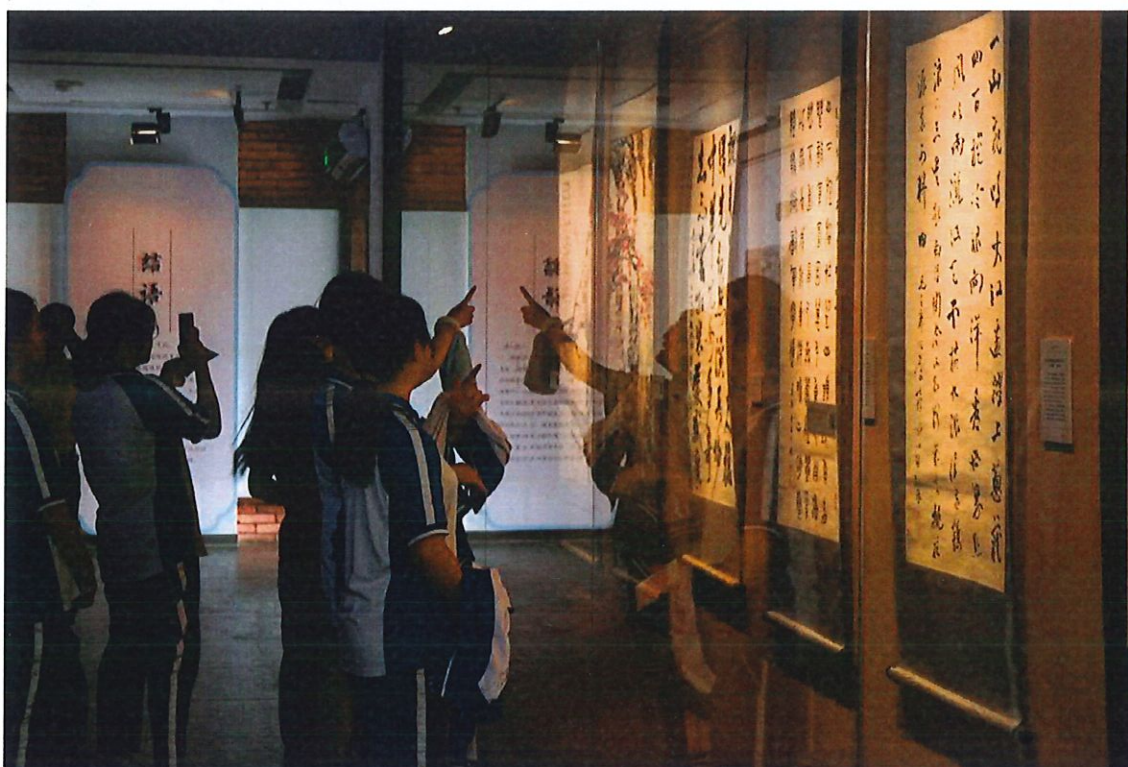
《翰墨北海——北海公园园藏书画珍品展》现场

墨北海——北海公园园藏书画珍品展》中，在展厅内设计北海白塔、小船的场景，吸引观众打卡留念。《文物动物园》展中，面向孩子们开展文物知识趣味问答活动。