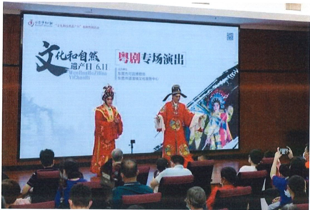
2022年文化与自然遗产日活动——粤剧专场演出