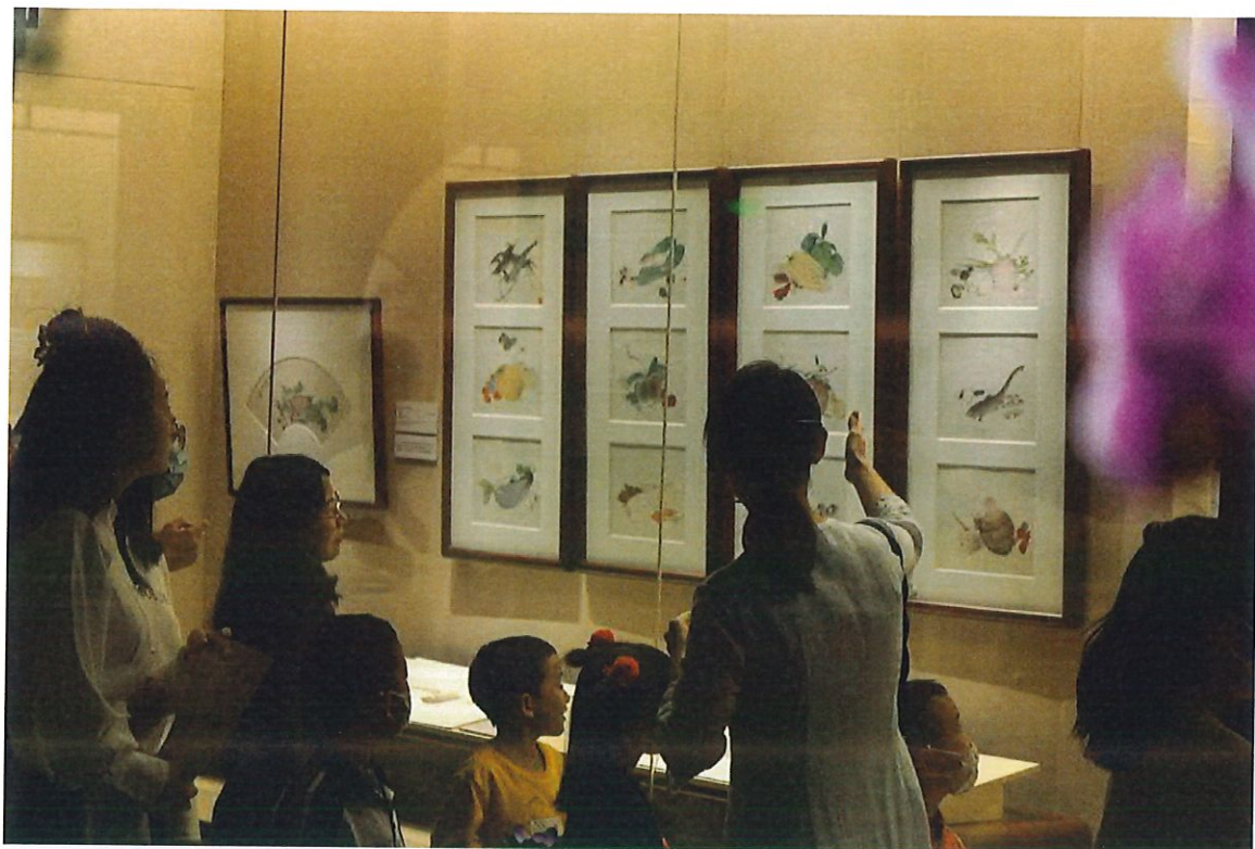
“自是花中第一流——东莞馆藏居巢居廉绘画精品特展”展览现场图片