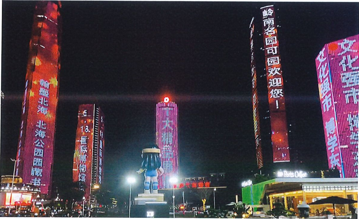
打造全市首个文博主题灯光秀