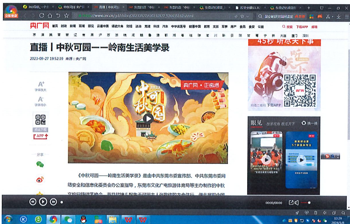
央广网“中秋可园——岭南生活美学录”直播入口

园——岭南生活美学录》，中秋期间在人民日报视频客户端、新华网客户端、央广网等 20 多个平台全网直播，在线观看人数超过 600 万，可园文化 IP 魅力传遍全国，为文化东莞注入全新活力。活动以东莞可园历史内涵为主题，举办面向高层次人才、行业精英、艺术家等目标群体的“岭南四时春”、“文铭双清，寻找可园知音”双清室赞铭补遗全国征集等有特色、有品位的文化活动。主办岭南名园“四园联动”交流会，探讨四园联票、联合办展、联合推介、文创开发等，增强岭南名园的文化品牌集群效应。