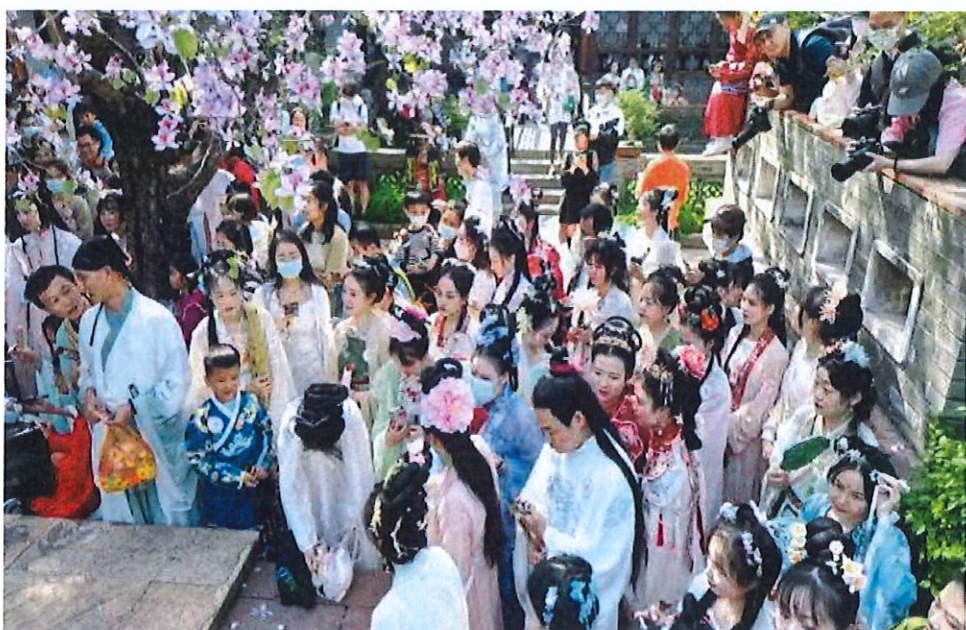
2023 年花朝节可园“十二花神”竞选活动