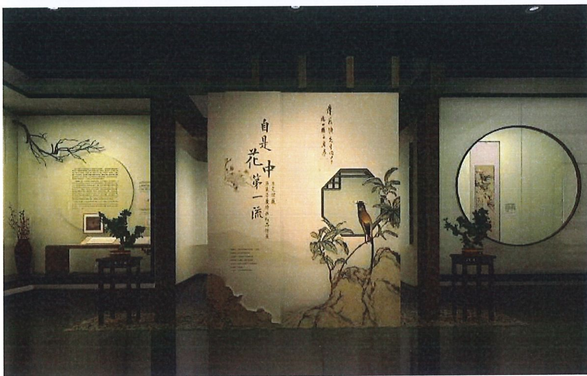
“自是花中第一流——东莞馆藏居巢居廉绘画精品特展”展览现场图片

物馆及东莞市博物馆两馆珍藏的 140 余件“二居”书画精品，全面展现“二居”艺术特色、历史性成就和近代岭南艺术精神，是近年岭南规模最大、研究性强、本土原创性“二居”书画展览。本次展览及活动紧扣“博学东莞·1+4”模式，围绕专题展览，设有“新时代明伦堂”文博讲座、博物馆进校园、流动博物馆、“博物馆之夜”等 4 类配套活动近二十项，借助全媒体网络平台力量掀起宣传热潮。据统计整个展览有二十余万观众观展，近二十家国家、省、市重要媒体进行报道 101 篇，并入选“四月份全国博（馆）百个精选大展”。