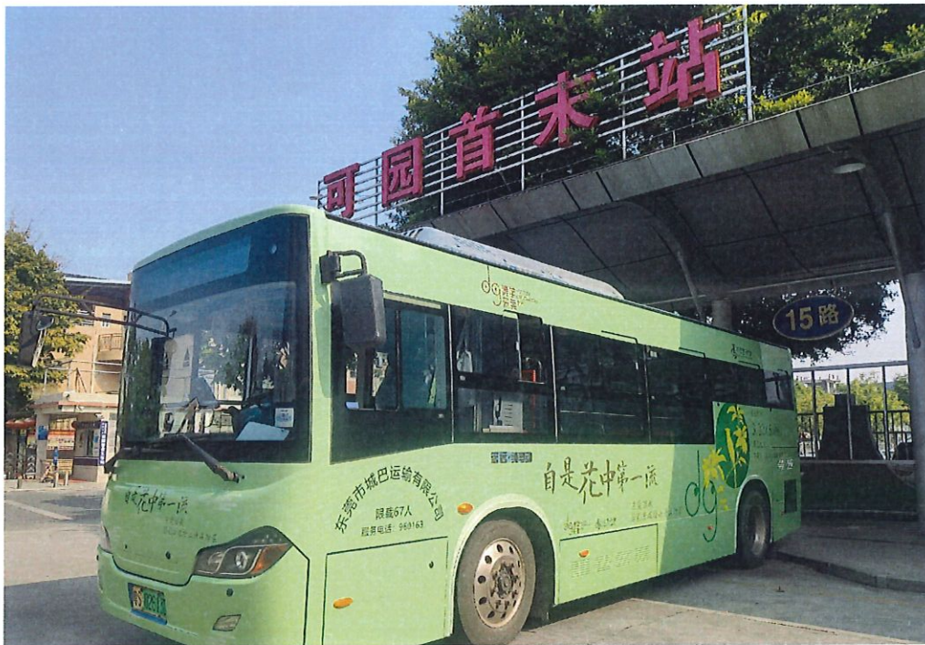
打造东莞首条公交文博号“可园”号