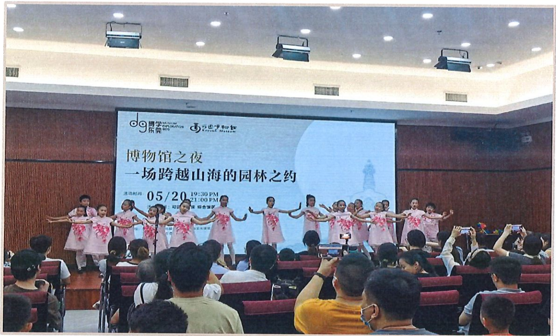
“博物馆之夜——一场跨越山海的园林之约”现场

二是策划展览配套教育活动。成功举办“博物馆之夜——一场跨越山海的园林之约”，以北海白塔为切入点，结合展览文物背后的故事历史信息以及文物价值，举办以互动导赏、毛主席诗词朗诵、经典儿童歌曲表演等活动，构建起展览与儿童观众的情感连接。