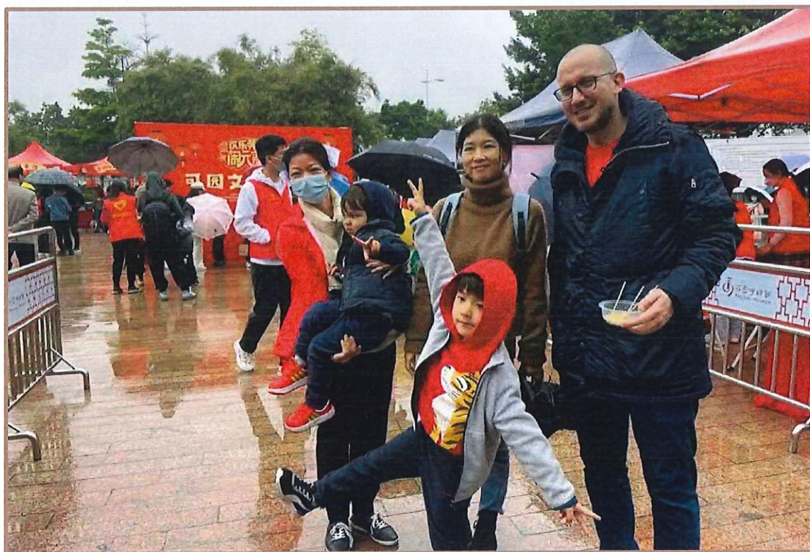
首届“可园文化庙会·元宵”活动

一是举办节庆惠民活动。春节前后，举办“迎新春送祝福”2023年迎春挥毫送春联、“来可园过国风文化年”系列活动、元宵节推出首届“可园文化庙会·元宵”活动、重阳节举办“童心向阳——可园重阳敬老活动”“庆国庆品粤韵乐悠游”活动。