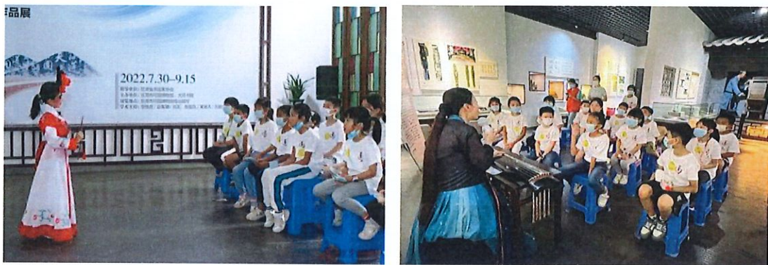
2022年“可园小学士”夏令营活动之传统文化项目体验环节

四是举办岭南四时春雅集。联合东莞松山湖人才创新创业促进会、中国国际茶文化研究会、东莞市木子文化传播有限公司等策划推出面向高层次人才、行业精英、艺术家等目标群体的雅集活动六场。以东莞可园历史内涵，举办“文铭双清，寻